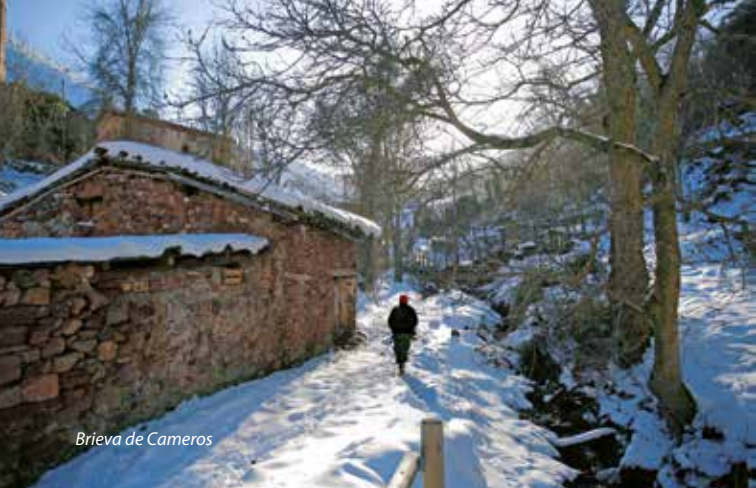
Brieva de Cameros

Constan testimonios históricos de esta villa desde el siglo X, ya que un sacerdote de la localidad fundó en esa época un oratorio que sería el embrión del monasterio de Valvanera. Brieva acogió a la patrona de La Rioja durante la desamortización de Mendizábal hasta la apertura del monasterio. La ganadería y la trashumancia han marcado la vida de esta localidad. De gran interés paisajístico, desde Brieva se puede ver la imponente belleza de la Sierra de Cameros.