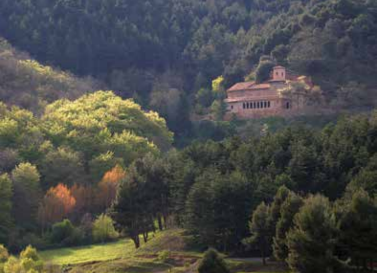
Vista de Suso.

Otras rutas: La Asociación senderista de Anguiano edita los folletos Rutas entre hayedos por la mancomunidad de Anguiano, Matute y Tobía (2,50€ )