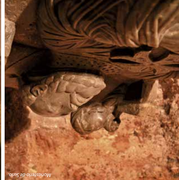
Monasterio de Suso.

En torno a Yuso surgen las diferentes construcciones relacionadas con el mismo, tal como el antiguo hospital del Monasterio y molinos y almácenos que se transformaron en viviendas con el paso del tiempo.