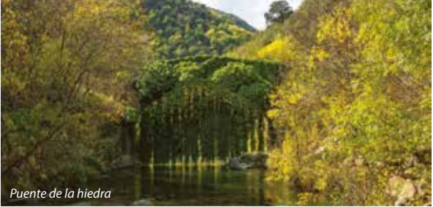
Puente de la hiedra

Los ríos Najerilla y Neila se unen aquí para desembocar en el pantano de Mansilla. Su casco urbano se distribuye en pequeñas callejas que vienen a dar a una plazuela con vistas al río. En Villavelayo nació y creció (s. XI) Santa Aurea, ermitaña del Monasterio de Suso, y cuya biografía narra en verso Gonzalo de Berceo en Poema de Santa Oria.