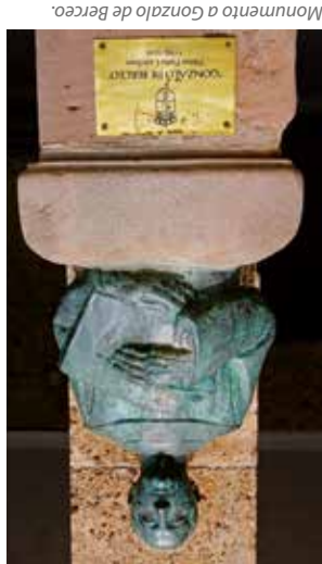
Monumento a Gonzalo de Berceo.

Si el Códice 46, terminado de copiar en el monasterio de la Cogolla sobre el 13 de junio del año 964, significa los inicios del castellano escrito, Gonzalo de Berceo, que vive y escribe fundamentalmente en la primera mitad del siglo XIII, significa los inicios de la literatura en castellano. De ahí la importancia de San Millán para el conocimiento de los orígenes de la lengua y de la literatura españolas.