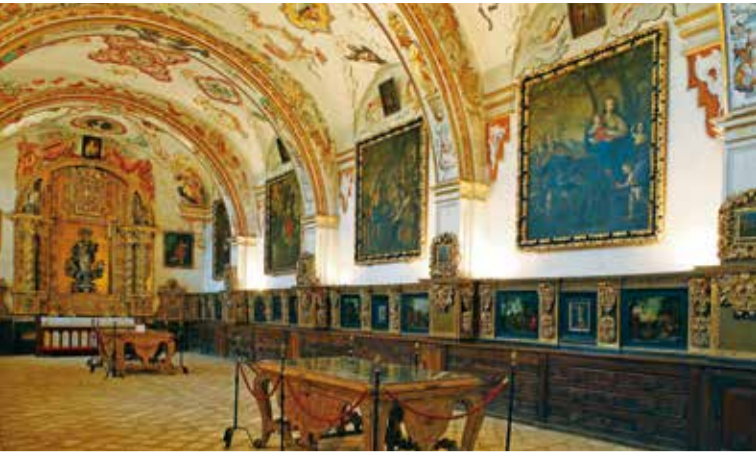
Sacristía de Yuso.

Esta localidad de tradicionales edificios con heráldica se divide en dos barrios. Se puede visitar la torre con reloj en lo alto de un risco que domina el pueblo y el museo etnográfico que guarda mas de 2.000 piezas. Es de gran interés también un rollo picota de cuatro cabezas y el puente de la hiedra, en la carretera comarcal poco antes de la Venta de Goya.