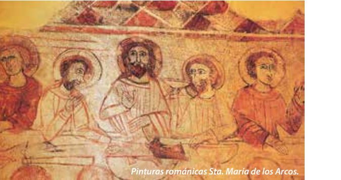
Pinturas románicas Sta. María de los Arcos.

En el siglo XVIII el interior de la basílica se cubrió con yeserías barrocas. La talla original de la Virgen de Arcos, una Virgen negra prerrománica, del siglo XI , se encuentra en la iglesia parroquial de Tricio. Tel.: S. M. de los Arcos: 636 820 589