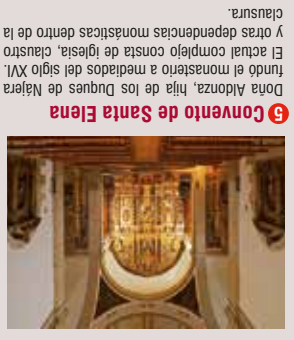
6 Convento de Santa Elena El actual complejo consta de iglesia, claustro y otras dependencias monásticas dentro de la Abadía cisterciense, una de las primeras de España. La iglesia del monasterio sorprendió fundado el monasterio a mediados del siglo XVI.