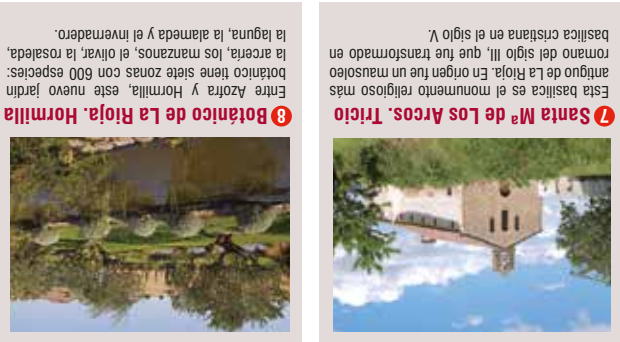
7 Botánico de La Rioja, Hormilla Entre Azofra y Hormilla, este nuevo jardín botánico tiene siete zonas con 600 especies: la acera, los manzanos, el vivero, la rosaleda, la laguna, la alameda y el invernadero.