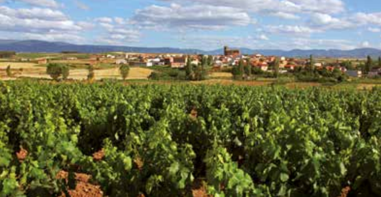
Panorámica de Azofra.

En el Camino, antes de llegar a Nájera, un cerro sobresale aislado sobre los demás: el mítico “Poyo Roldán” , escenario de otra variante de esas leyendas evocadoras de luchas entre caballeros medievales, tan extendidas por aquellos lugares del Camino de Santiago donde mayor influencia tuvo la Orden de Cluny. Se trata del relato que narra el combate entre el gigante Ferragut y Roldán, caballero al servicio de Carlomagno.