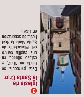
6 Iglesia de la Santa Cruz Esta parroquia se fundó en 1052, y hasta su separación en 1230.