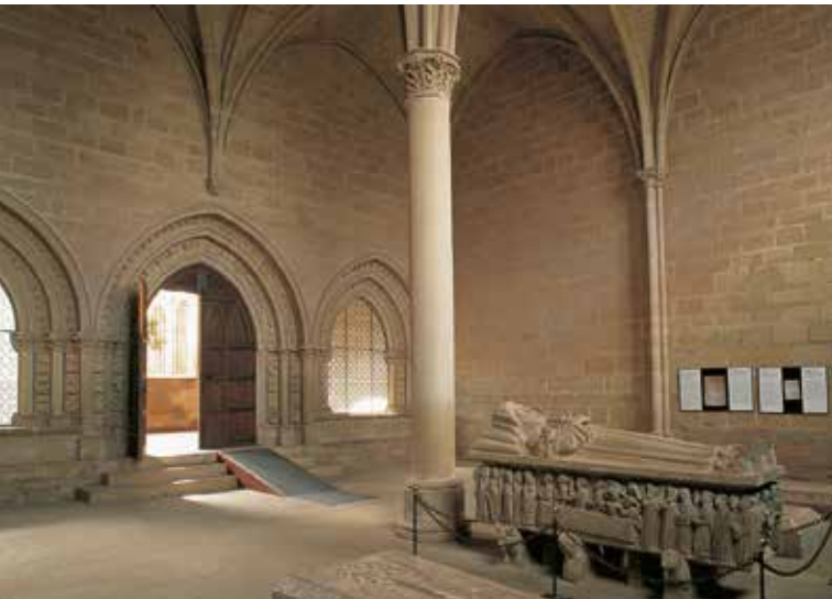
Abadía cisterciense de Cañas.

Aunque data del año 1054, el templo actual fue consagrado en 1611. Está construido en piedra sillar y consta de tres naves y nueve altares. Alberga las reliquias de San Prudencio , entre otros santos y cuadros procedentes de Santa María la Real.