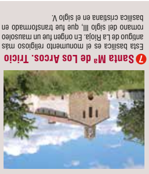
7 Santa Mª de Los Arcos, Tricio Esta basílica es el monumento religioso más antiguo de La Rioja. En origen fue un mausoleo romano del siglo III, que fue transformado en basílica cristiana en el siglo V.