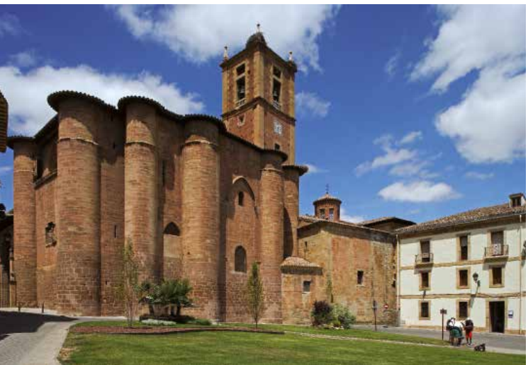
Santa María la Real de Nájera y Museo Najerillense.

La denominación de Nájera proviene del ascendiente árabe Naxara , lugar entre peñas. Según se desprende de yacimientos prehistóricos, el valle del Najerilla fue habitado por el hombre del paleolítico superior e inferior. También se establecieron en ella tribus celtas. Alrededor del 714, los árabes convirtieron a Nájera en fortaleza y baluarte de La Rioja Alta. En el año 918 nace el reino de Nájera , al entregar el rey de Pamplona, Sancho Garcés a su hijo García Sánchez las tierras del Ebro desde Miranda Tudela. Fue reocupada por los árabes y posteriormente reconquistada por el rey Ordoño II, y fue entregada a García Sánchez. A partir de entonces se instaló en Nájera la corte navarra, convirtiéndose en capital del reino y cuna de reyes .