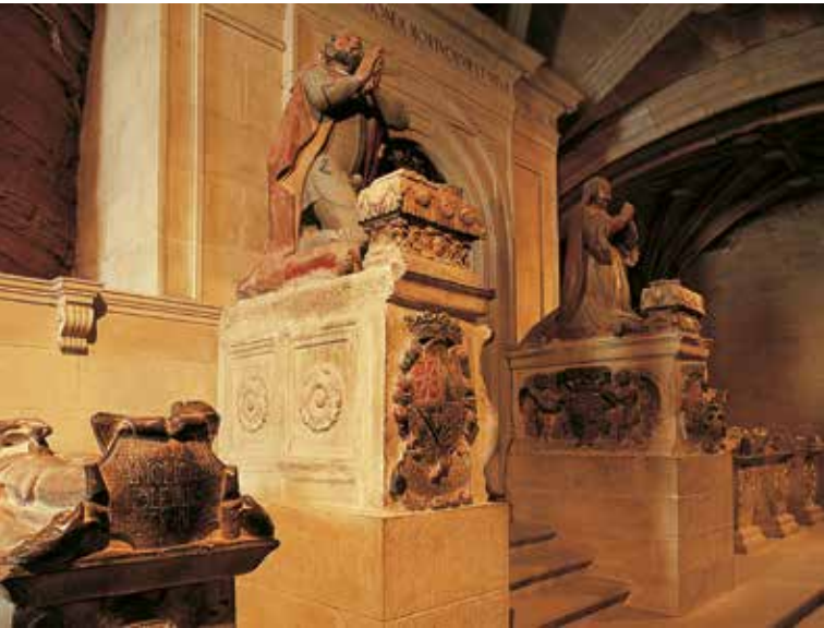
Panteón Real de Santa María la Real de Nájera.