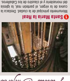
6 Santa María la Real Monumento principal de la ciudad. Destaca la catedral de la Virgen, el panteón real, la iglesia del monasterio y el claustro de los Caballeros.