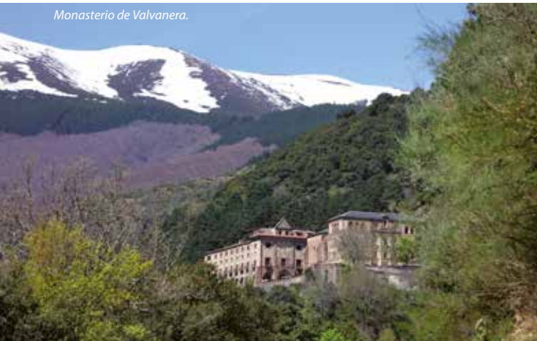
Monasterio de Valvanera.