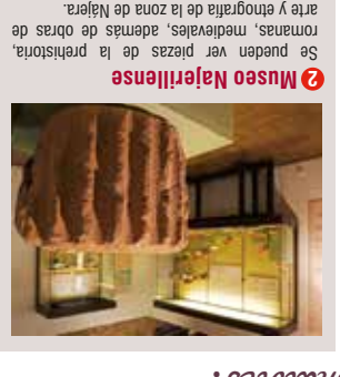
6 Museo Najerlense Se pueden ver piezas de la periferia romana, medievales, además de obras de arte y etnografía de la zona de Najera.